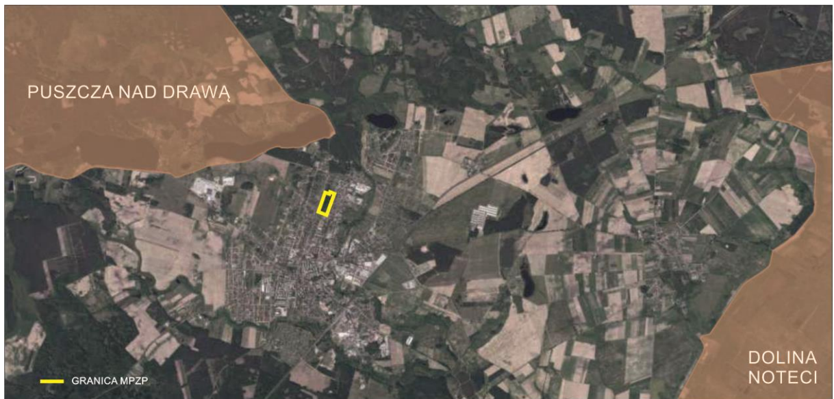
Rysunek 2 Obszar objęty miejscowym planem zagospodarowania przestrzennego na tle obszarów chronionych- Obszary Chronionego Krajobrazu.

bagiennych spotkać można m.in. sowę błotną, zaś w okolicy Tuczna zlatują wiosną i jesienią tysiące żurawi.