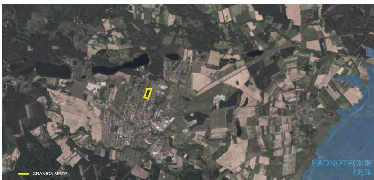
Rysunek 1 Obszar objęty miejscowym planem zagospodarowania przestrzennego na tle obszarów chronionych- Obszary Natura 2000. Oprac. własne na podstawie http://geoserwis.gdos.gov.pl/mapy/

Na terenie gminy Trzcianka znajdują się fragmenty dwóch obszarów chronionego krajobrazu: