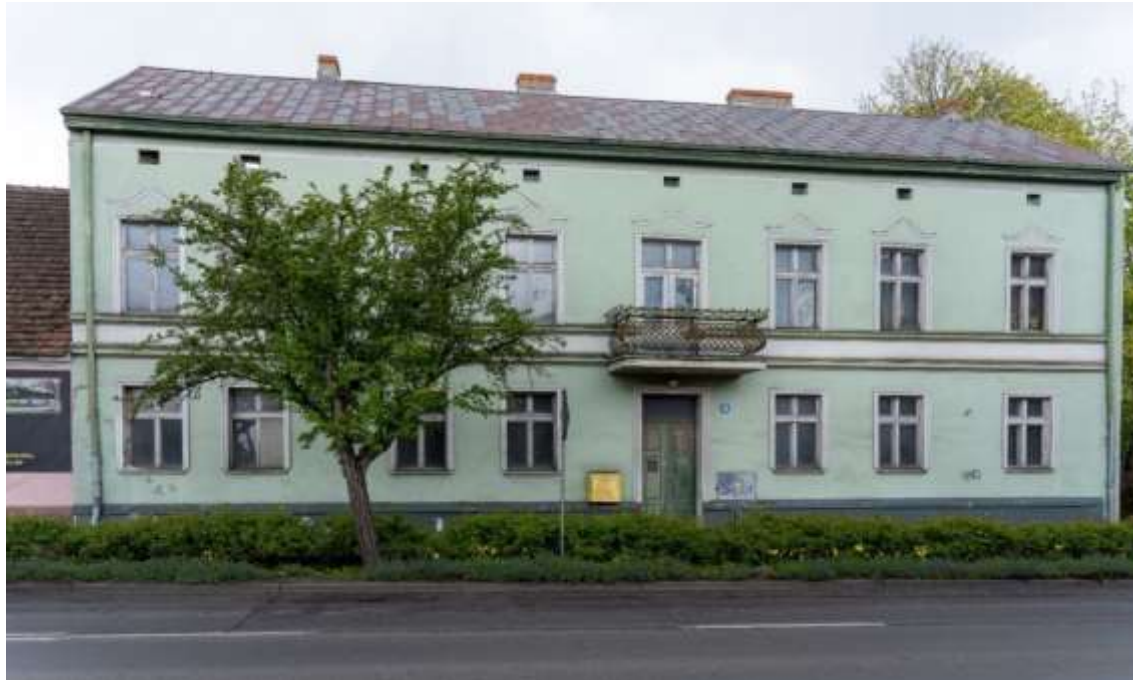
Rysunek 19. Kamienica przy ul. Sikorskiego 16