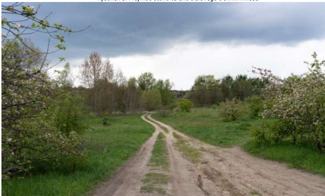
Rysunek 8. Przykład stanu terenu zielonego Dolinki Miłości