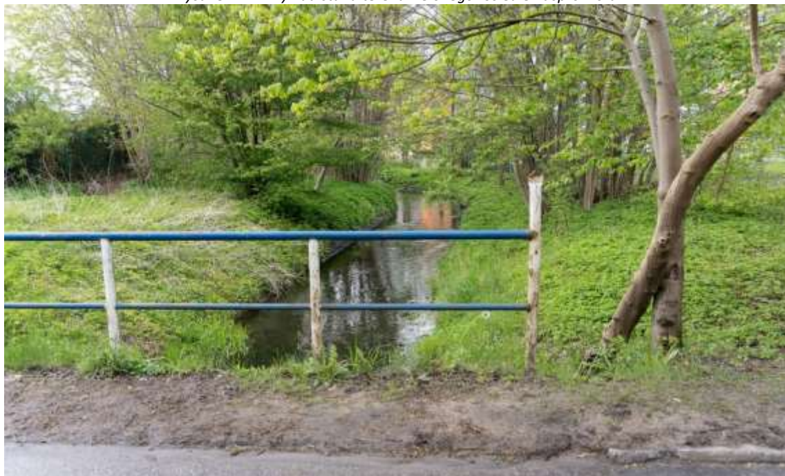
Rysunek 12. Przykład stanu terenu zielonego- osiedle Kasprowicza