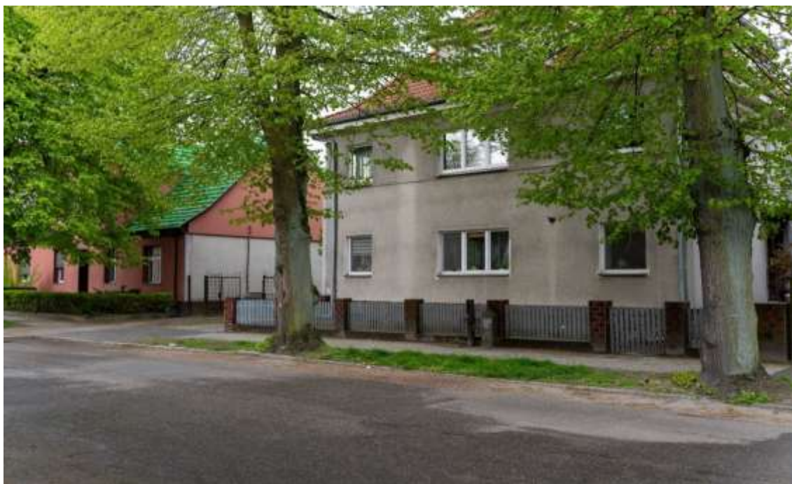
Rysunek 17. Kamienica przy ul. Mickiewicza