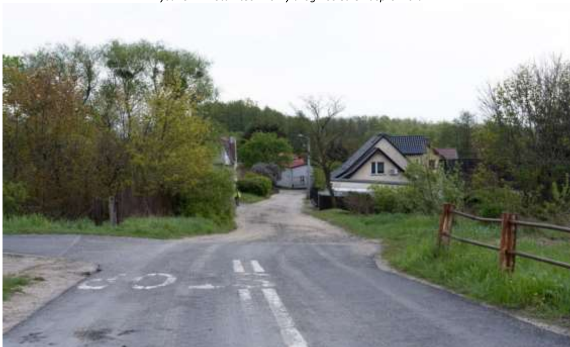
Rysunek 14. Stan techniczny drogi- osiedle Kasprowicza