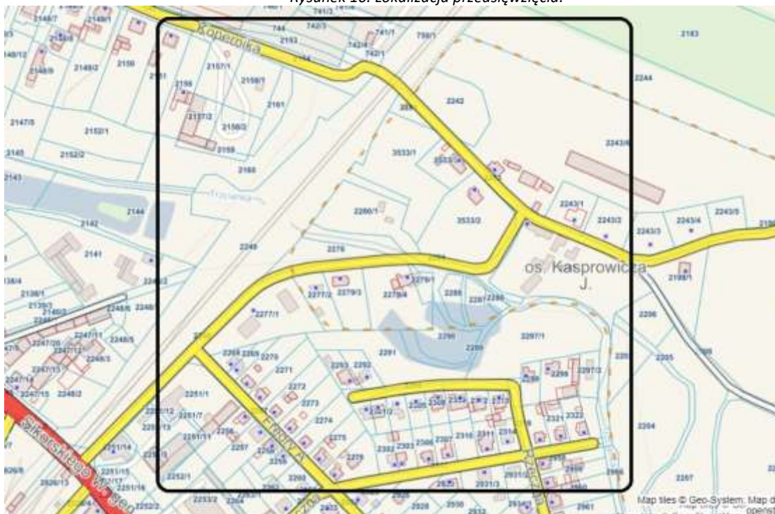
Rysunek 10. Lokalizacja przedsięwzięcia.

Obszar tematyczny przedsięwzięcia: społeczny i przestrzenno-funkcjonalny.