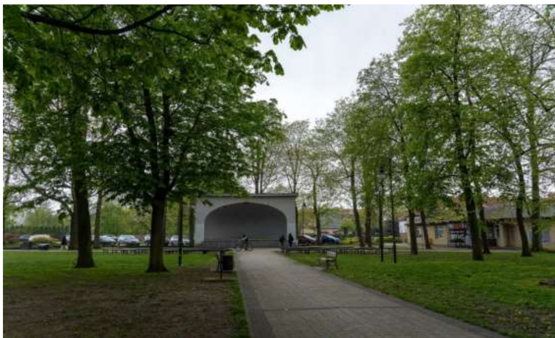
Rysunek 20. Park 1 Maja w Trzciance

Źródło: materiały z wizji lokalnej przeprowadzonej w dniu 24.04.2024 r.