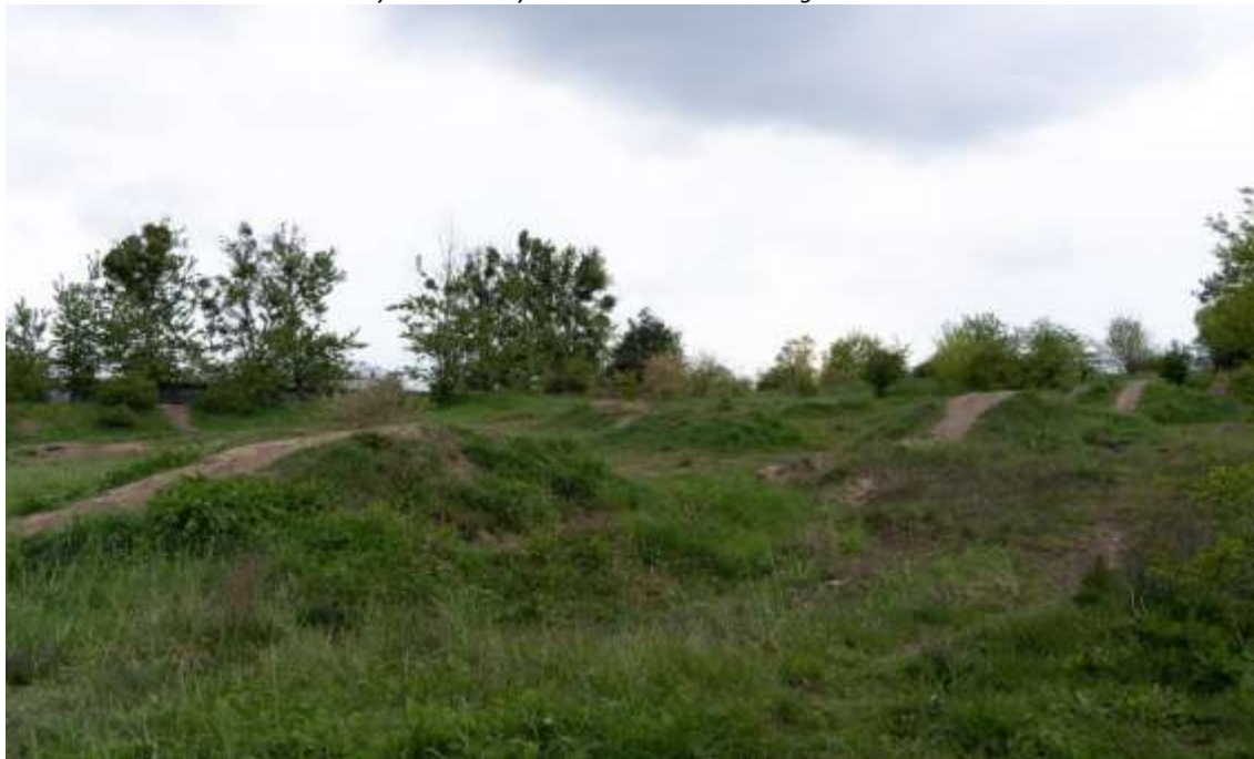
Rysunek 7. Przykład stanu terenu zielonego - Dolinki Miłości.