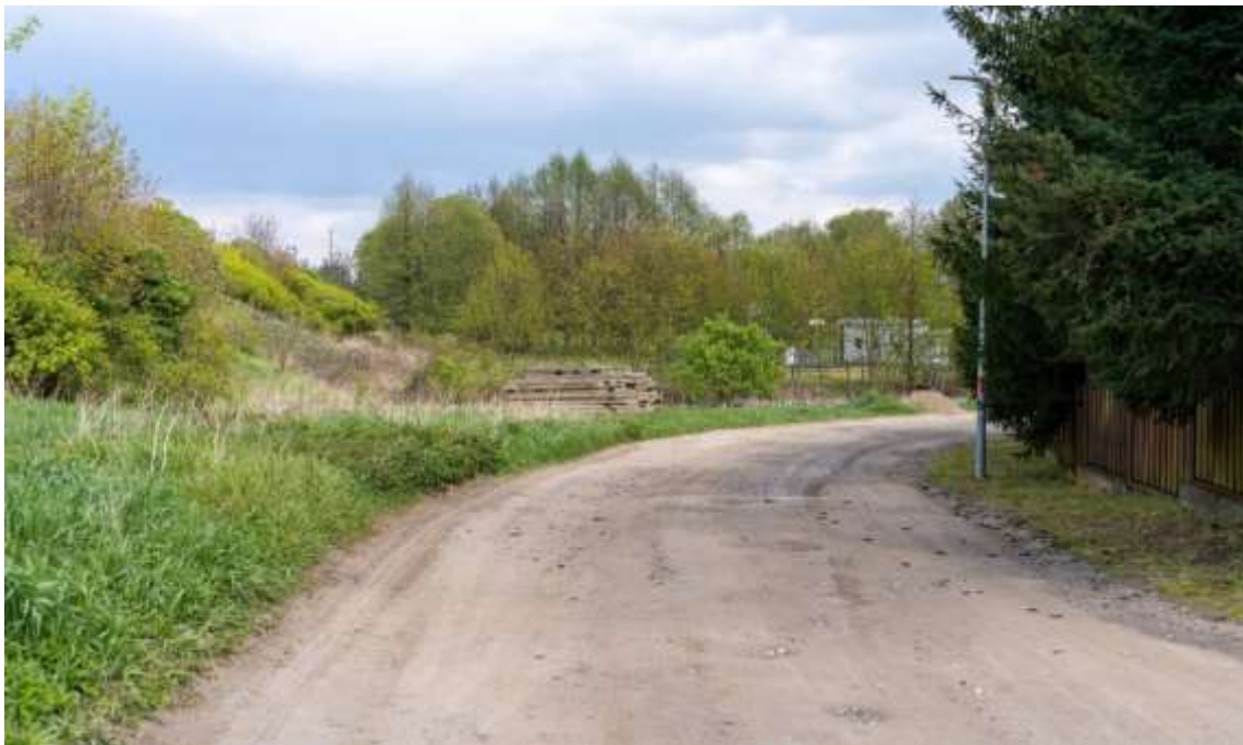
Rysunek 11. Stan techniczny drogi – osiedle Kasprowicza