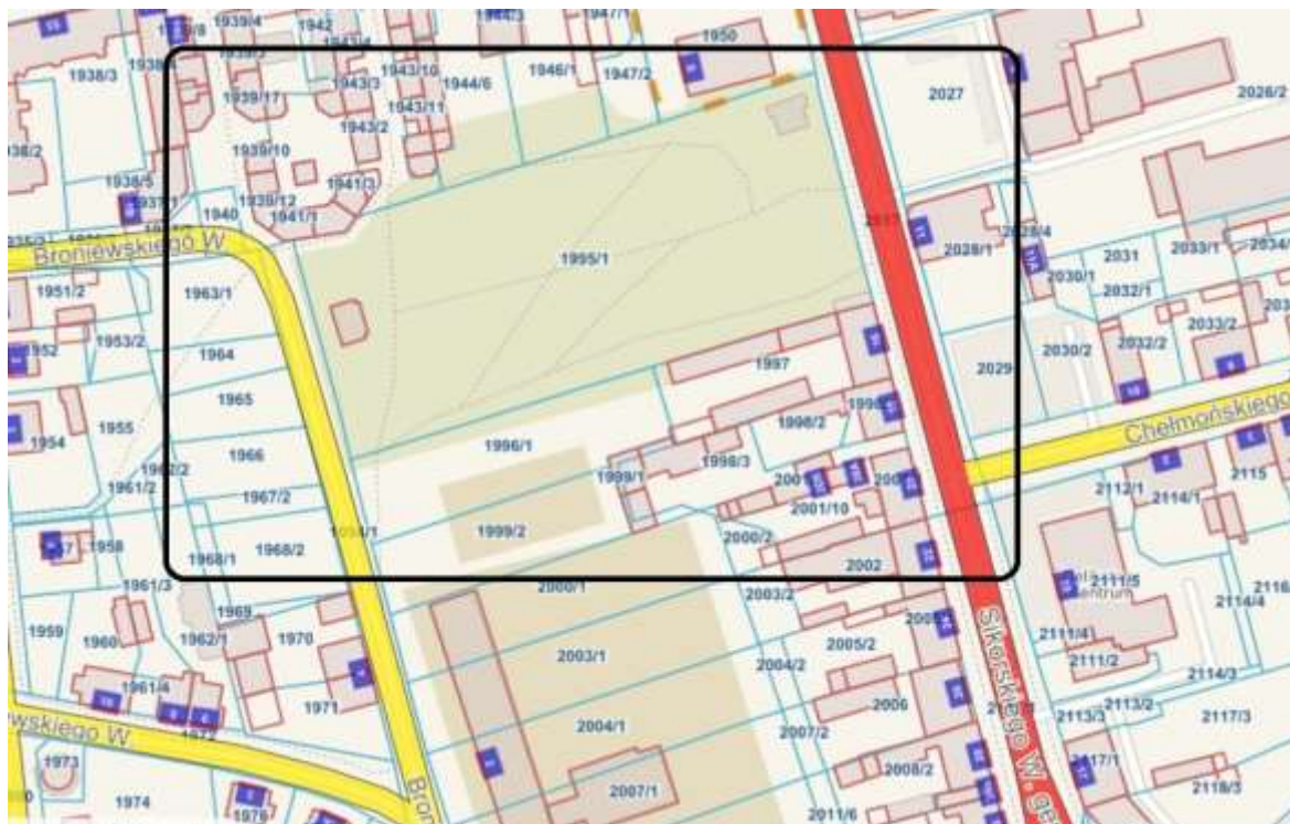
Rysunek 18. Lokalizacja przedsięwzięcia

Obszar tematyczny przedsięwzięcia: społeczny, środowiskowy.