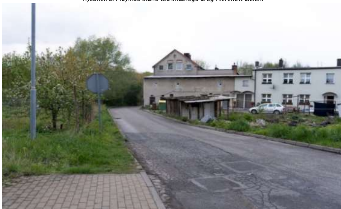
Rysunek 3. Przykład stanu technicznego dróg i terenów zieleni