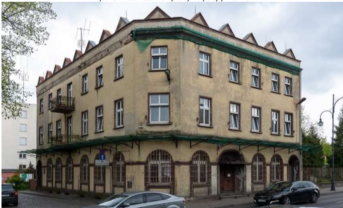
Rysunek 4. Stan techniczny budynku po byłym banku.