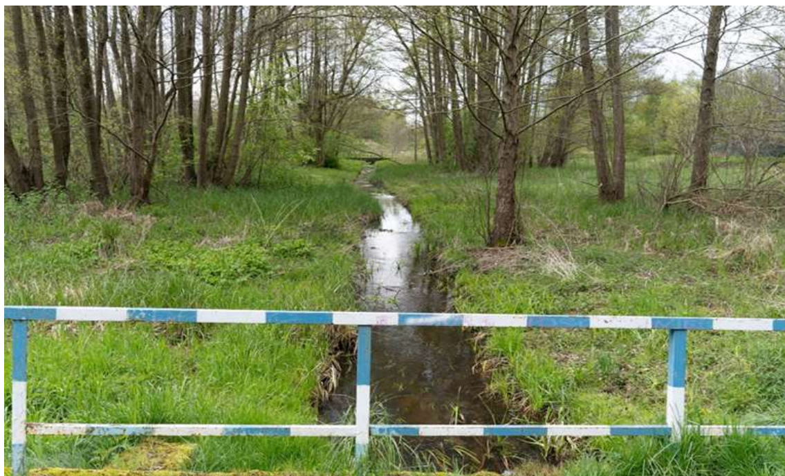
Rysunek 9. Przykład stanu terenu zielonego Dolinki Miłości.