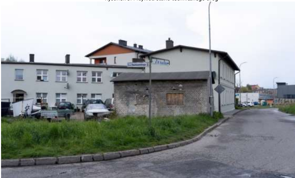
Rysunek 5. Przykład stanu technicznego dróg