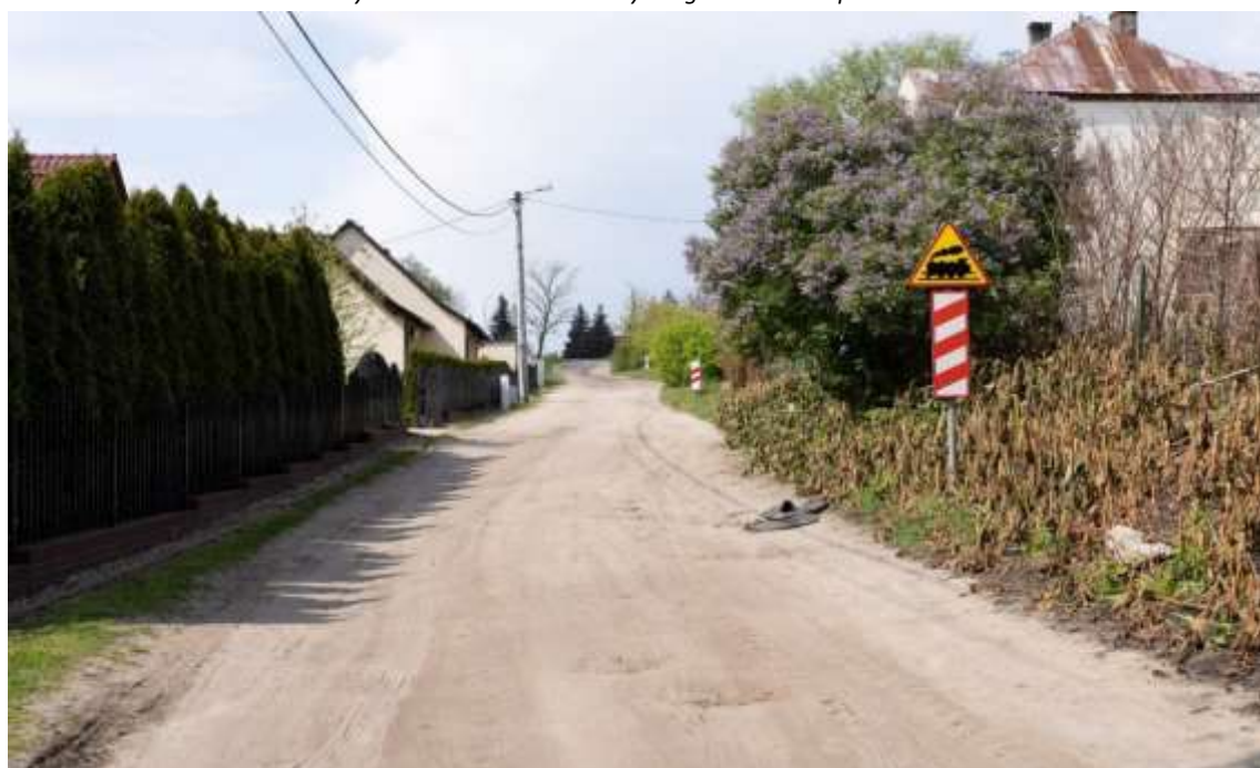
Rysunek 13. Stan techniczny drogi- osiedle Kasprowicza