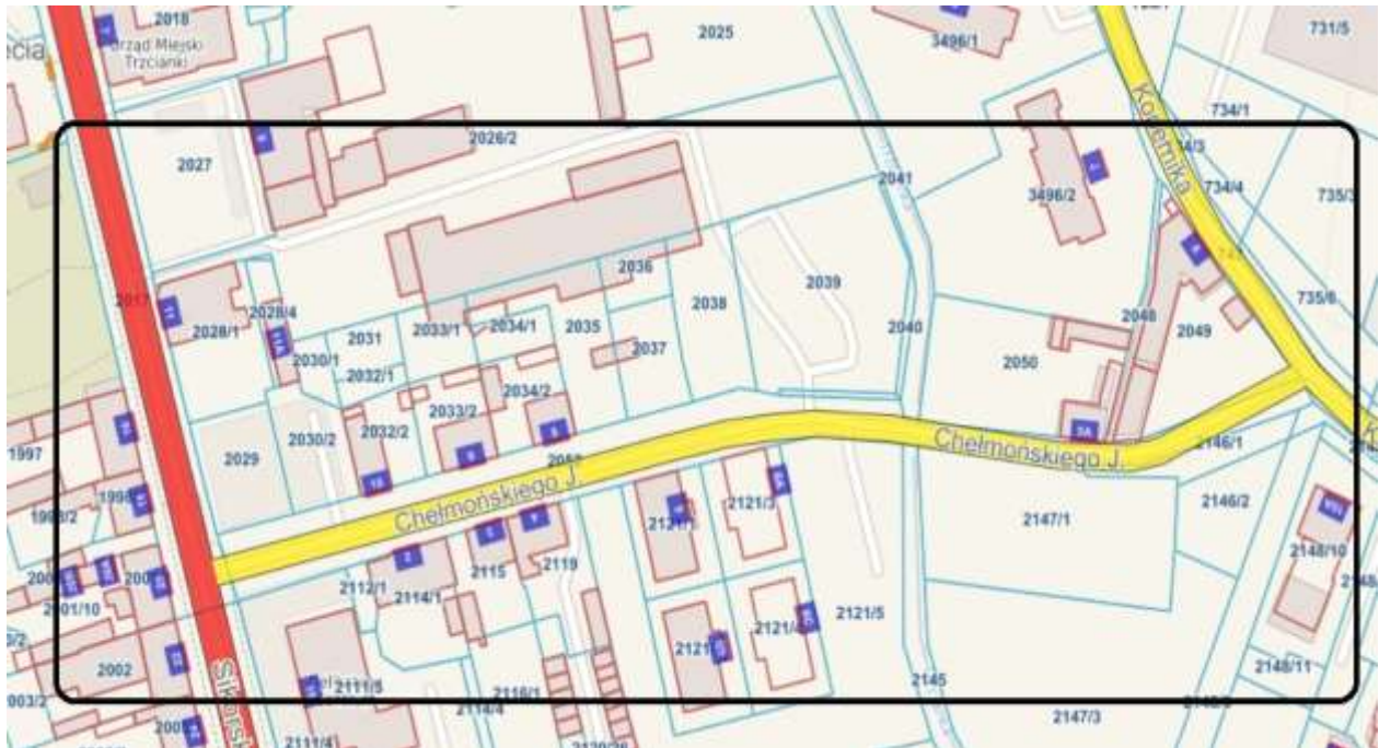
Rysunek 2. Lokalizacja przedsięwzięcia.

Obszar tematyczny przedsięwzięcia: przestrzenno-funkcjonalny.