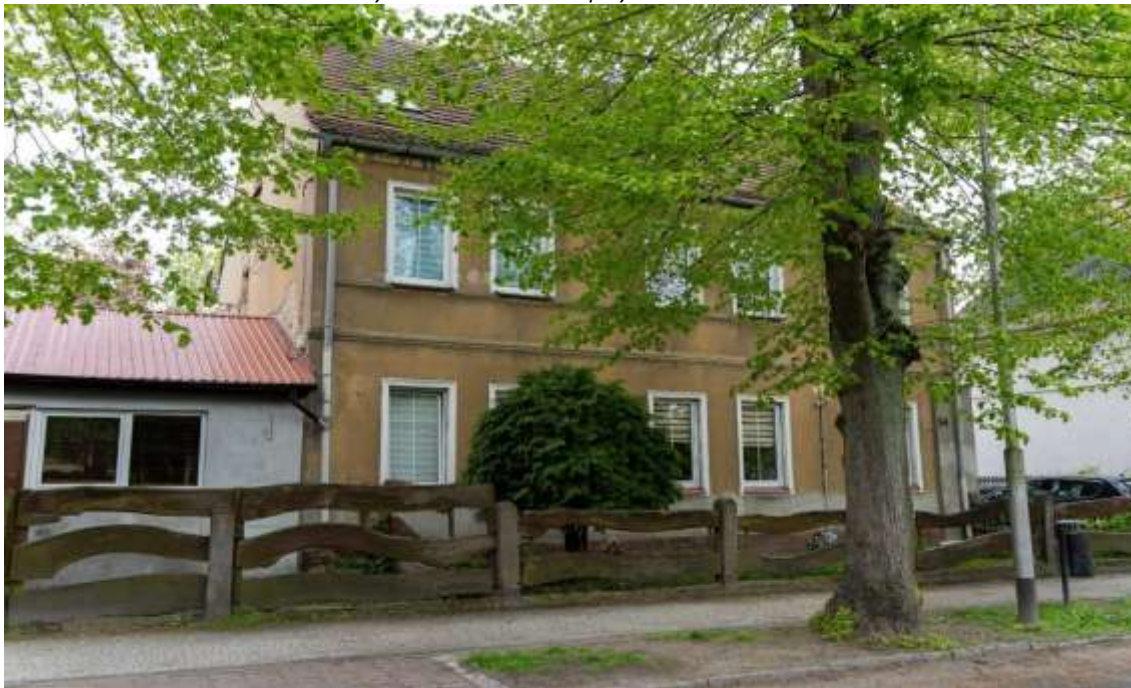
Rysunek 16. Kamienica przy ul. Mickiewicza